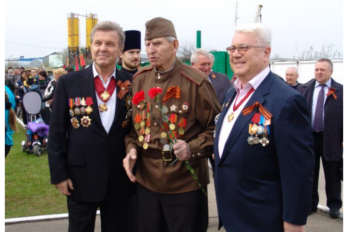
Лев Лещенко и Владимир Винокур поздравляют героев ВОВ

Я каждый месяц получаю письма с просьбами о материальной помощи на восстановление какого-нибудь храма, обители или на какие-то другие