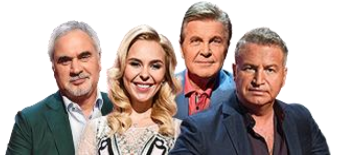
Л.Лещенко – один из наставников популярного телешоу «Голос» на 1-м канале